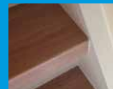
HPL / CPL

Wij werken met verschillende soorten materialen, zoals eikenhout en HPL/CPL, om uw trap weer veilig, mooi en slijtvast te maken. Naast ledverlichting voor de trap hebben we ook rvs trapleuningen en bijpassend laminaat.